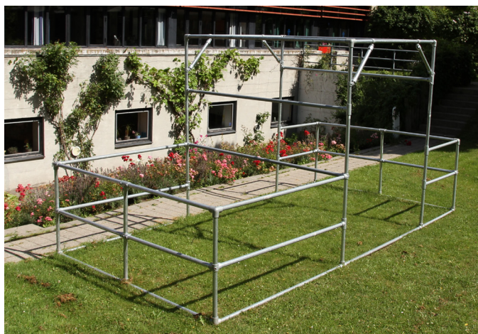
Parkourstativet foran ungdomsskolen. Stativet er tegnet af parkourholdets trænere og elever og lavet af vandrør af en lokal smed. Stativet kan skilles ad og samles af eleverne og har bl.a. været med til Medborgerdagen.

For nogle år tilbage fik en gruppe unge i Albertslund ideen til et parkourhold, og når Albertslund Ungdomsskole slår dørene op