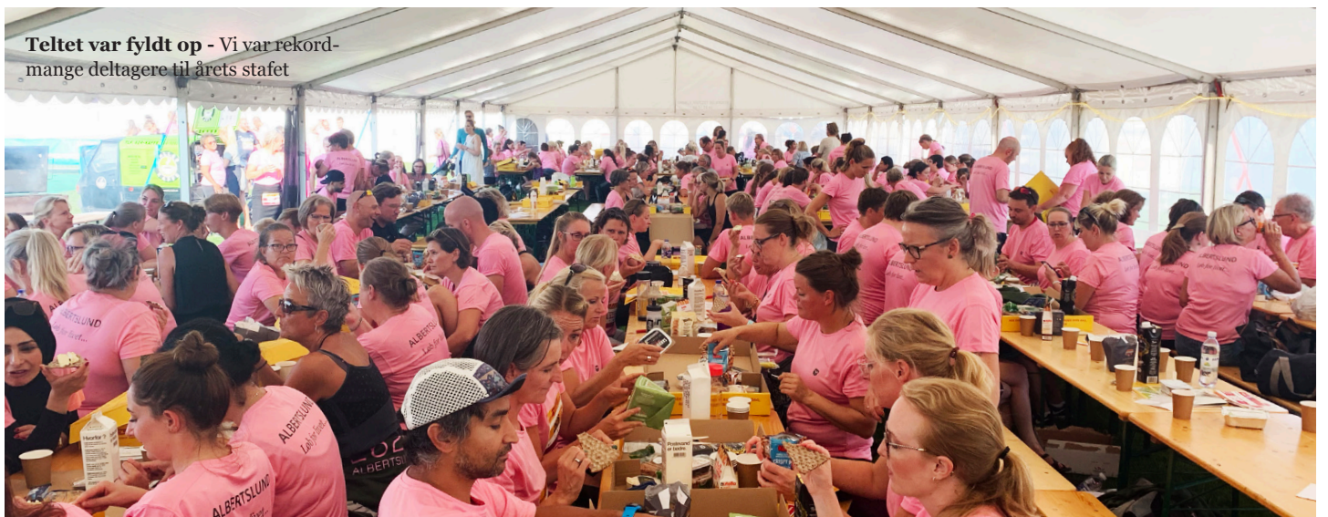
Teltet var fyldt op - Vi var rekordmange deltagere til årets stafet