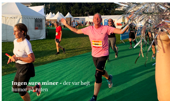
Ingen sure miner - der var højt humør på ruten