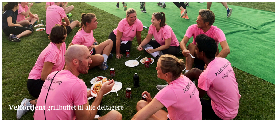
Velfortjent grillbuffet til alle deltagere