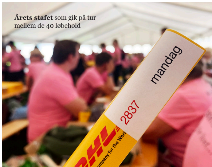
Årets stafet som gik på tur mellem de 40 løbehold