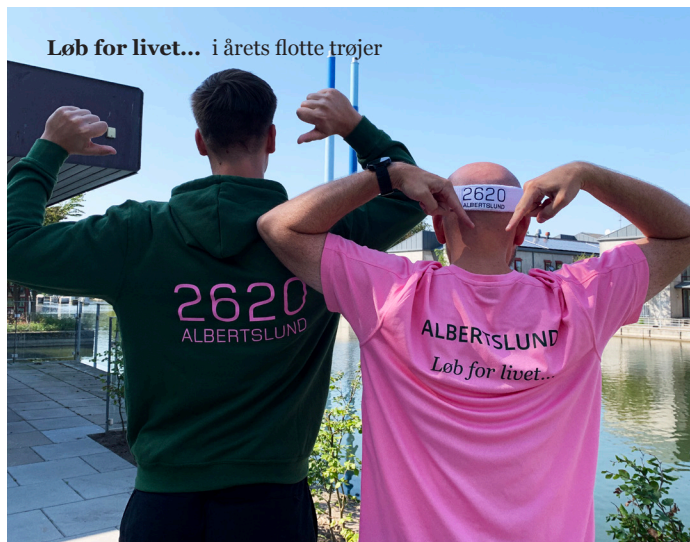
Løb for livet... i årets flotte trøjer