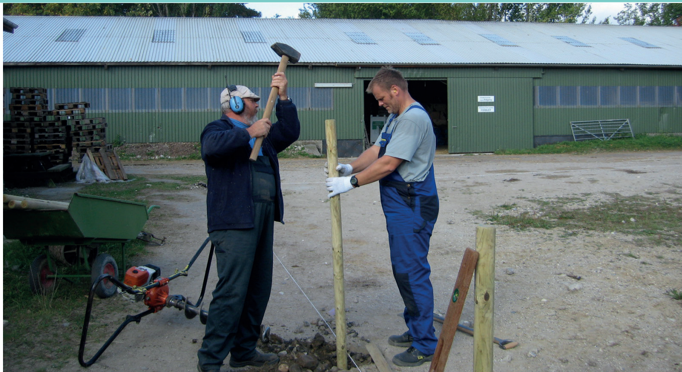
VI SLÅR DET FAST med sytommersøm. Faktisk med pæle, Praktik har potentiale. Nu er tiden inde til at tilmelde sig enten som praktikant eller praktikvært, så AlbertslundPraktik igen i år bliver en succes og giver en masse medarbejdere og ledere nye perspetiver.