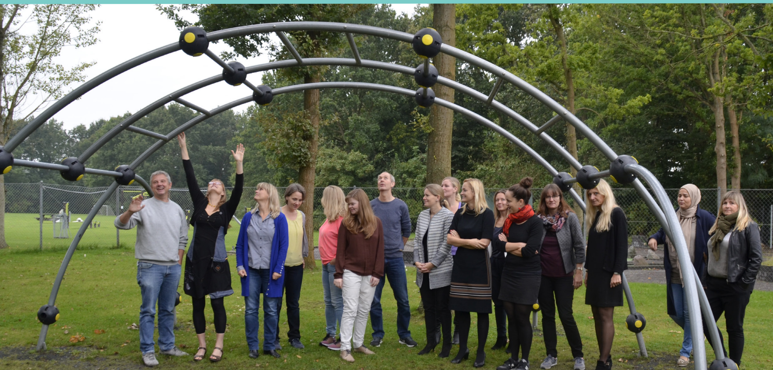
De 18 nye "astronaut" i Albertslund Kommune.